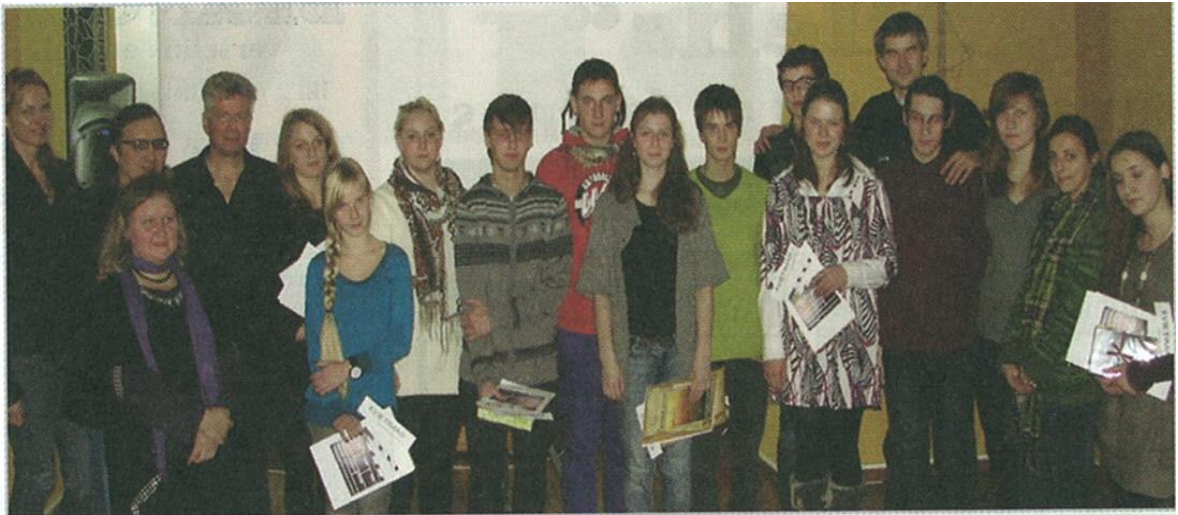
Festivaliui filmus sukūrė visų trijų miesto mokyklų ir Troškūnų K. Inčiūros vidurinės mokyklos moksleiviai